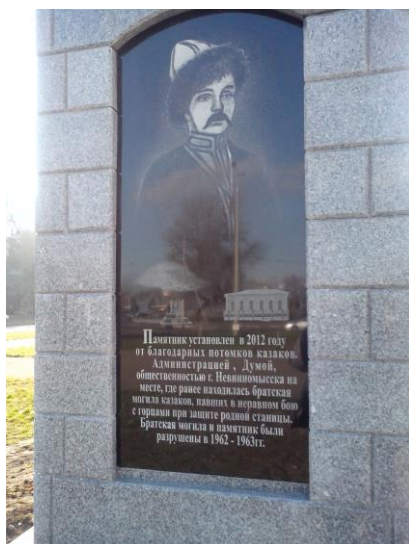
Вид памятника с северной стороны