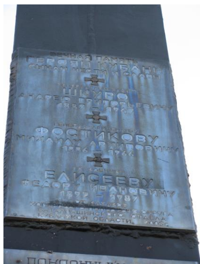
Андрей Григорьевич Шкуро[9.4]

Настоящая фамилия Шкура, родился 7 февраля 1887 в станице Пашковская Кубанской области. Русский военный деятель, кубанский казак, офицер.