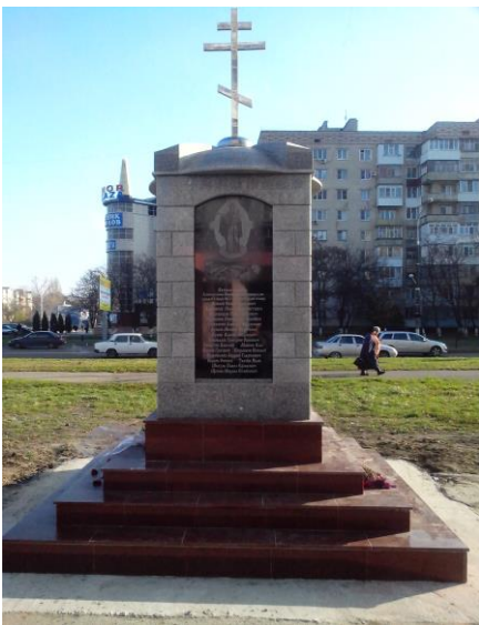
Вид памятника с западной стороны