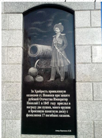
Вид памятника с южной стороны.