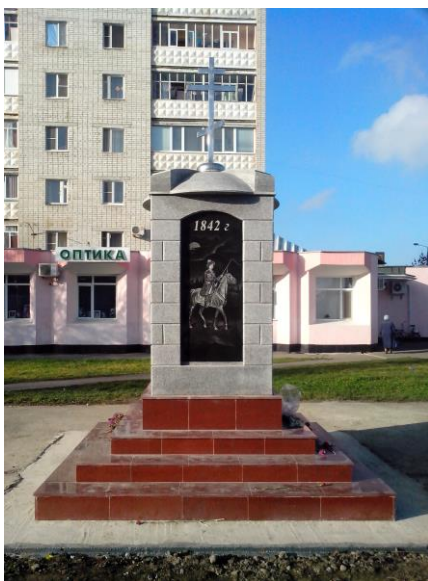
Вид памятника с восточной стороны.