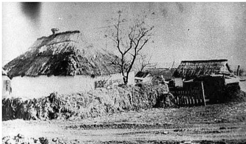
Станица Невинномысская - начало XX в.

На Покрова Пресвятой Богородицы 14 октября 1825 года, в чудесный день бабьего лета, прошел обряд освящения места поселения казаков у Невинномысского редута, а территорию будущей станицы опахали плугом. Территория была поделена на четырехугольники, в которых разбивались усадьбы, а между четырехугольниками прокладывались улицы и переулки.